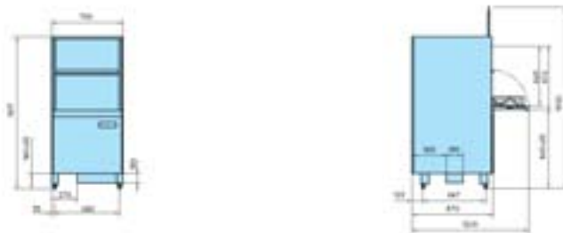
GS 640 Energy