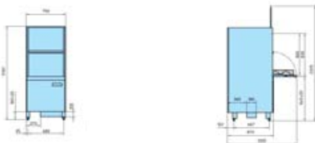
GS 650 Energy