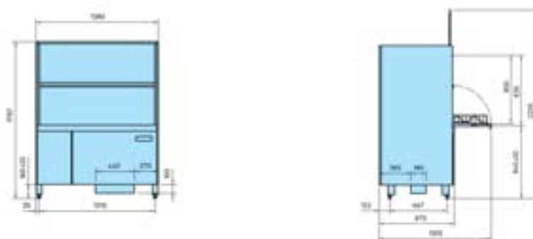
GS 660 Energy